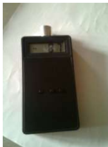
Рис 4. Головка прибора в момент снятия показаний