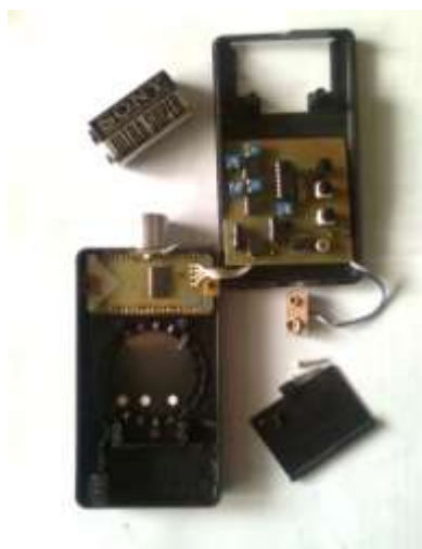
Рис. 3. Чувствительная головка прибора со снятой крышкой

На рис. 3, 4 показаны чувствительная головка прибора в разобранном состоянии и головка прибора в момент снятия показаний.