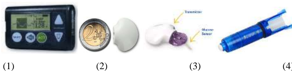
Рис. 1. Основні компоненти системи Guardian REAL-Time (фірма Medtronic Minimed, Канада) [13]

Система Guardian REAL-Time складається з таких основних компонентів (див. рис. 1): монітор системи Guardian REAL-Time (1); передавач Medtronic MiniLink (2); сенсор Medtronic MiniLink (3); пристрій для встановлення сенсора Sen-Serter (4).